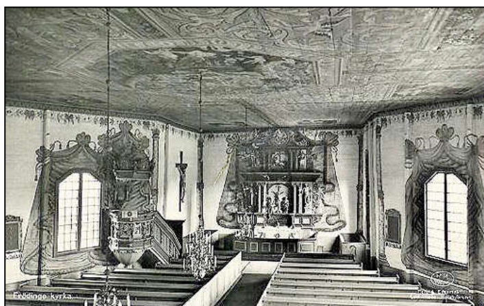
Interiör av Frödinge kyrka

Frödinge nuvarande kyrka byggdes under åren 1739-1744. "Häradshövdingen Peter Hjertstedt på Gunnekulla tog på sig ledarskapet för byggnationen och försköningen med storartad frikostighet," som det står i Frödinge sockenbok. Eftersom han var ägare till 10,5 mantal inom socknen hade han ju ekonomisk möjlighet med detta.