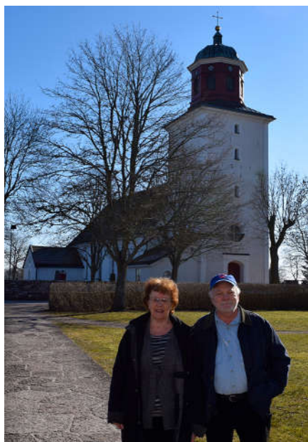
Besök vid Torslunda kyrka.

Vårt nästa stopp på Öland blev hos en "sixth cousin" Himmelsberga. I den här gården var Emmas farmor född. Här blev det rundvandring med fotografering av gamla bilder i gården