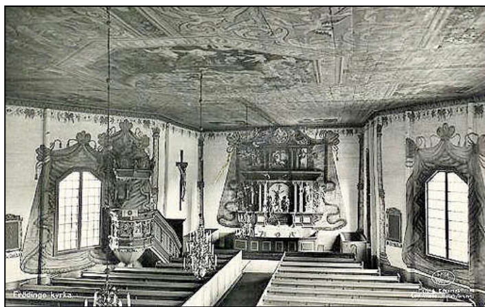
Interiör av Frödinge kyrka